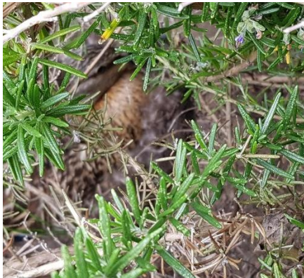
zoek de eend

Helaas betekent dit voor de tuincommissie dat er niet veel gedaan kan worden in de schooltuin. Maar het werk in de schooltuin vervangen we door onkruid wieden op het schoolplein aan de voorzijde.